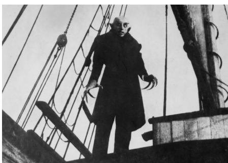
Les Fraises sauvages (Ingmar Bergman), Ghost Dog (Jim Jarmusch), Fitzcarraldo (Werner Herzog), Nosferatu le vampire (Friedrich Wilhelm Murnau). Collection Cinémathèque suisse. Tous droits réservés.