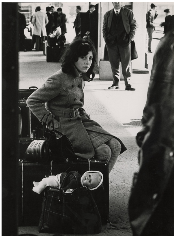
Gare de Brigue, 1966-1967