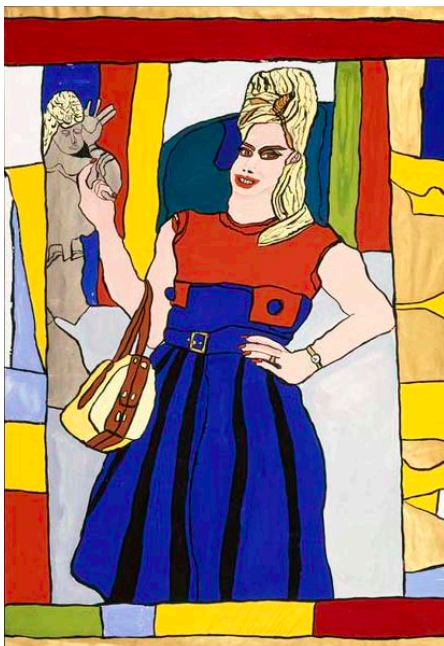
Joseph Wittlich, Frau mit Plastik , s.d., 90 x 62,5 cm, gouache et vernis doré sur papier blanc, Collection de l'Art Brut Lausanne.

Les auteurs d'Art Brut conçoivent leurs œuvres en marge du champ officiel de l'art et font donc fi de toutes règles ou normes en matière de création. Aussi, l'analyse du thème du cadre dans l'Art Brut proposée par Michel Thévoz se révèle passionnante, car les œuvres choisies en exemple tendent précisément à s'affranchir des cadres, quels qu'ils soient : au sens propre, celui en bois, le « frame » anglais qui entoure la composition, mais aussi celui défini par le support lui-même, voire celui que l'auteur y a tracé ; au sens figuré, le cadre entendu comme l'ensemble des conventions en matière de représentation.